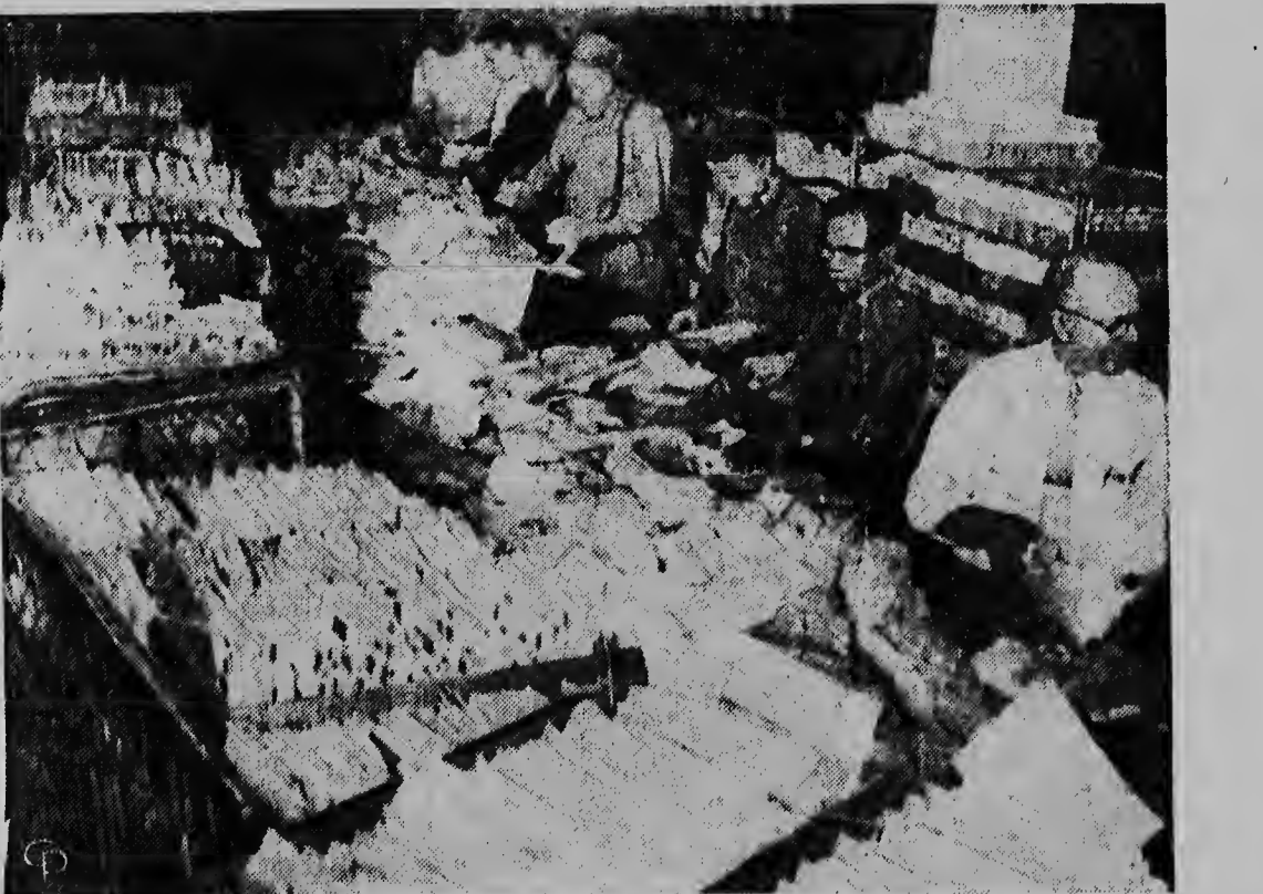
Aqui nos ta mira e correo na Chicago ta demostrando un cantidad grandi carta postal i otro cartanan cu no por ser entrega pa falta di bon direccion. Durante dianan di Pascu mester a quima como 73.000 dje cartanan aqui pa dia.

Corrimto den boto ta sumamente gozoso, pero si bo no sa ainda, no drenta boto chikito. E hende cu ta sali su so den un barco di bela sin sa navega ta un loco mes. Corriente di awa por cambia den poco minuut. Weso di algun di lo mihor navegadornan y di algun di lo mihor barconnan ta drumi na fondo di lamar, dnanando testimonio con traidor e bien-to y oianan ta. Si bo sa landa of no, bisti un salvavidá ora bo ta drenta un boto chikito. No bai leu foi tera den boto chikito sin bleki pa chica, of rema, hanker y cabuya di tow. Bo ta risca hopi si bo ta haci asina. Un canoa por ta un boto traidor. Experiencia y un bon cabez ta necesario pa navega den un: Pa cambia asiento den un boto di rema ta existi saber, pero — cambia asiento den un canoa ta nifica landa of sink. Pakico core tal risico? E mayor parti di nan ta masha costoso. E trabao di salba hende den awa